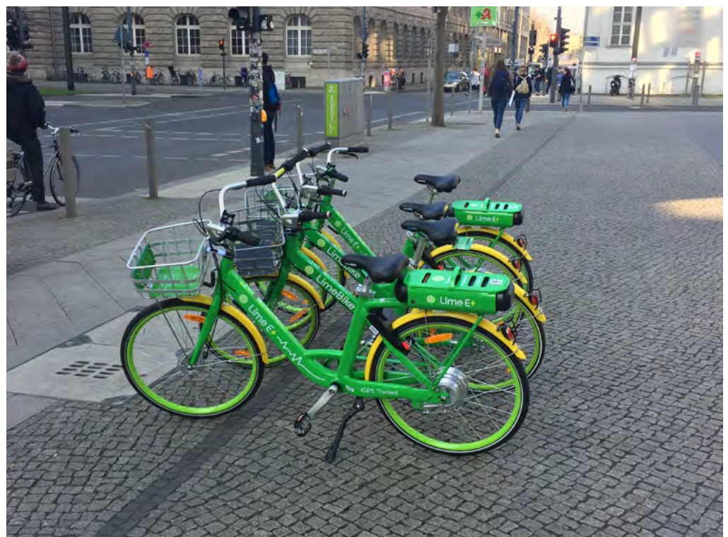
Abbildung 3.1: LimeBike ist aktuell der einzige stationslose Anbieter, der elektrische Leihräder (Lime-E) in Deutschland anbietet. Weitere Anbieter (u. a. Mobike) haben die Einführung von Pedelecs angekündigt.

Welche Handlungsansätze erweisen sich als sinnvoll, um Radverkehrsförderung und städtischen Zielen am besten zu dienen? An erster Stelle steht die aktive und transparente Kommunikation zwischen Kommunen und Anbietern auf einer verbindlichen und vertrauensvollen Basis. Sie ist ein zielführendes Mittel für den produktiven Umgang mit den Herausforderungen, die durch die neuen Systeme an die Kommunen herangetragen werden. Wenn Kommunen und Anbieter eine gemeinsame Handlungsbasis entwickeln und umsetzen, ergeben sich Gestaltungsspielräume, die auch ohne langfristige strategische Konzeption erfolgversprechend sind und rechtliche Auseinandersetzungen vermeidbar werden lassen. Letztere können zwar zur Klärung strittiger Positionen bzw.