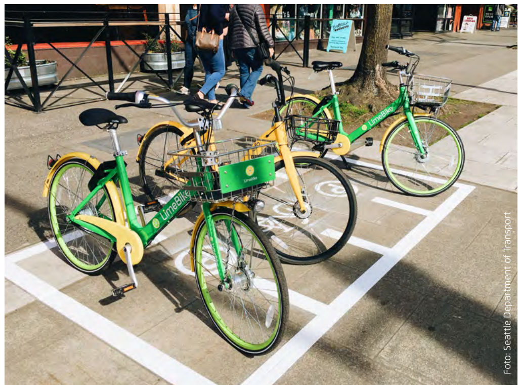
Abbildung 3.2: In Seattle werden markierte Stellflächen für ein geordnetes Abstellen stationsloser Leihfahräder erprobt.

Für die Art der Vereinbarung gibt es unterschiedliche denkbare Stufen und Formate, von einem verbindlichen