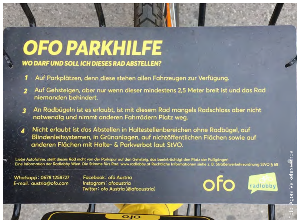
Abbildung 3.3: Die Radlobby Wien stellt einen Leitfaden für das Parken stationsloser Leihfahräder bereit. Ofo hat diese Hinweise aufgegriffen und auf den gelben Leihfahrrädern in Wien angebracht.