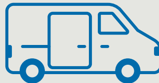
Transporter („Sprinter-Klasse“) 2,8 t bis \leq 7,5 t