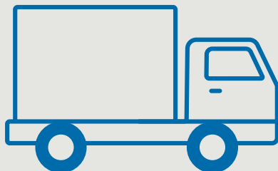
Motorwagen mit/ohne Anhänger 3,5 t bis \leq 40 t